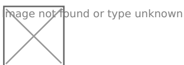
Рисунок 2.2 - Динамика движения персонала ООО «ПРОДСЕРВИС»

Данные таблицы 2.6 характеризуют персонал ООО «ПРОДСЕРВИС» как довольно постоянный, положительным является факт снижения коэффициента текучести персонала в течение всего исследуемого периода.