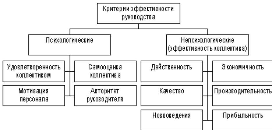
Рисунок 1.1 - Критерии эффективности управления персоналом[19]

Другими словами, эти критерии могут быть использованы применительно к оценке эффективности любого производственного коллектива. Итог жизнедеятельности коллектива – его эффективность, отражающая степень эффективности руководства им.